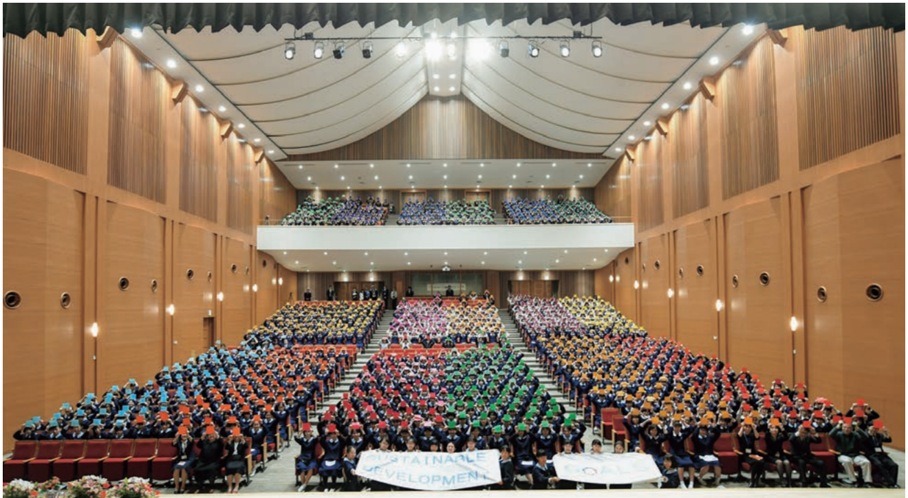
全校生徒がSDGsを色紙で表現しました。